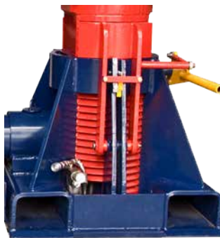
1 x Soporte Único Modelo 150T Derecho (N° de pieza TL13003)