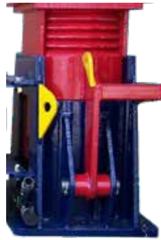
1 x Soporte Único Modelo 50T Derecho (N° de pieza TL13006)