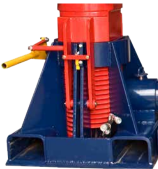
1 x Soporte Único Modelo 150T Izquierdo (N° de pieza TL13001)