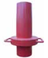
2 x Adaptadores Largos (N° de pieza HW75447)