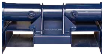
1 x Carro Central de Anchura Ajustable