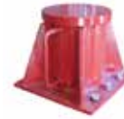
2 x Torretas (N° de pieza HW75434)