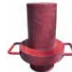
2 x Adaptadores Corto (N° de pieza HW75446)