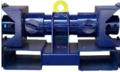
1 x Carro Central de Anchura Ajustable