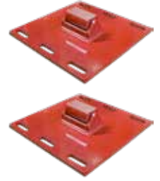
2 x Adaptadores de Silla Planos (N° de pieza TL13261)