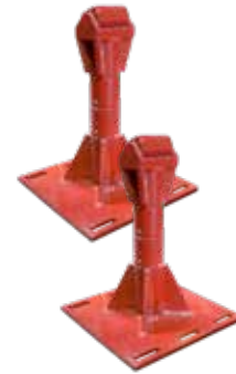
2 x Adaptadores de Silla de altura ajustable (N° de pieza TL13255)