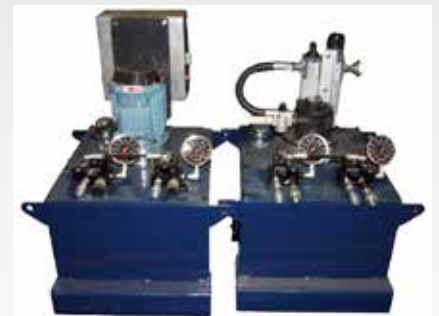
Generadores Eléctricos (N° de pieza CP03011) y Generadores Neumáticos (N° de pieza CP03015)

Al igual que las Plataformas Dobles, los Generadores se pueden mover con un gato de paleta, un elevador hidráulico o con un carro transportador eléctrico.