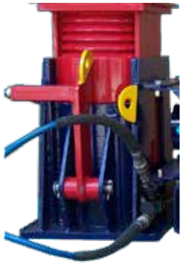
1 x Soporte Único Modelo 50T Izquierdo (N° de pieza TL13005)