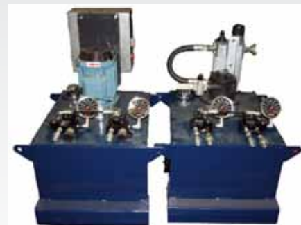
Caixa de Força Elétrica (Part No. CP03011) & Caixa de Força Pneumática (Part No. CP03015)

Assim como os Suportes as caixas de força podem ser movimentadas com nossa Paleta (Part. No. TL13250).