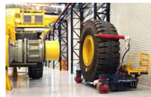
Trilift® TH15000 Workshop Tyre Handler