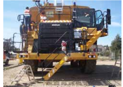
Safe-Away® RTV-S on Cat 777F

Le client a demandé un contrat de maintenance étant donné qu'il s'agissait d'un nouveau système. Un contrat de service mensuel a été signé entre notre client et notre agent au Brésil (BESC). Après six mois, le client a décidé que le contrat de maintenance n'était plus nécessaire du fait de la fiabilité des échelles électriques et de la simplicité du système de maintenance préventive sur site.