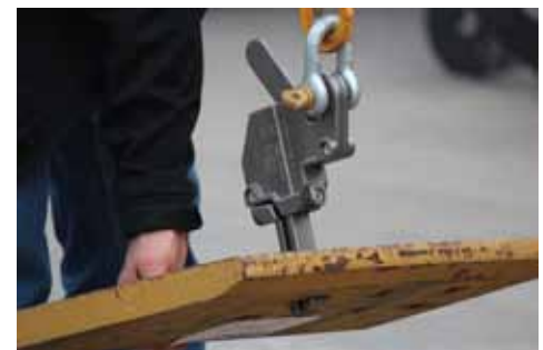
Trilift® Lever Pin N Lift