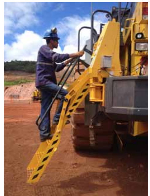
Safe-Away® EL-CF on Komatsu WD900