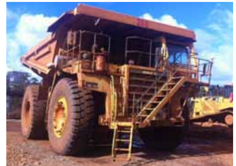
Safe-Away® EL-RTV on Komatsu HD785