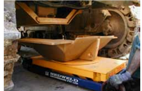
Trilift® Belly Pan Hoist