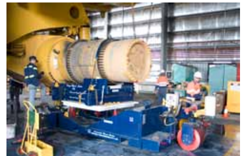
Trilift® Variable Work Table XC20